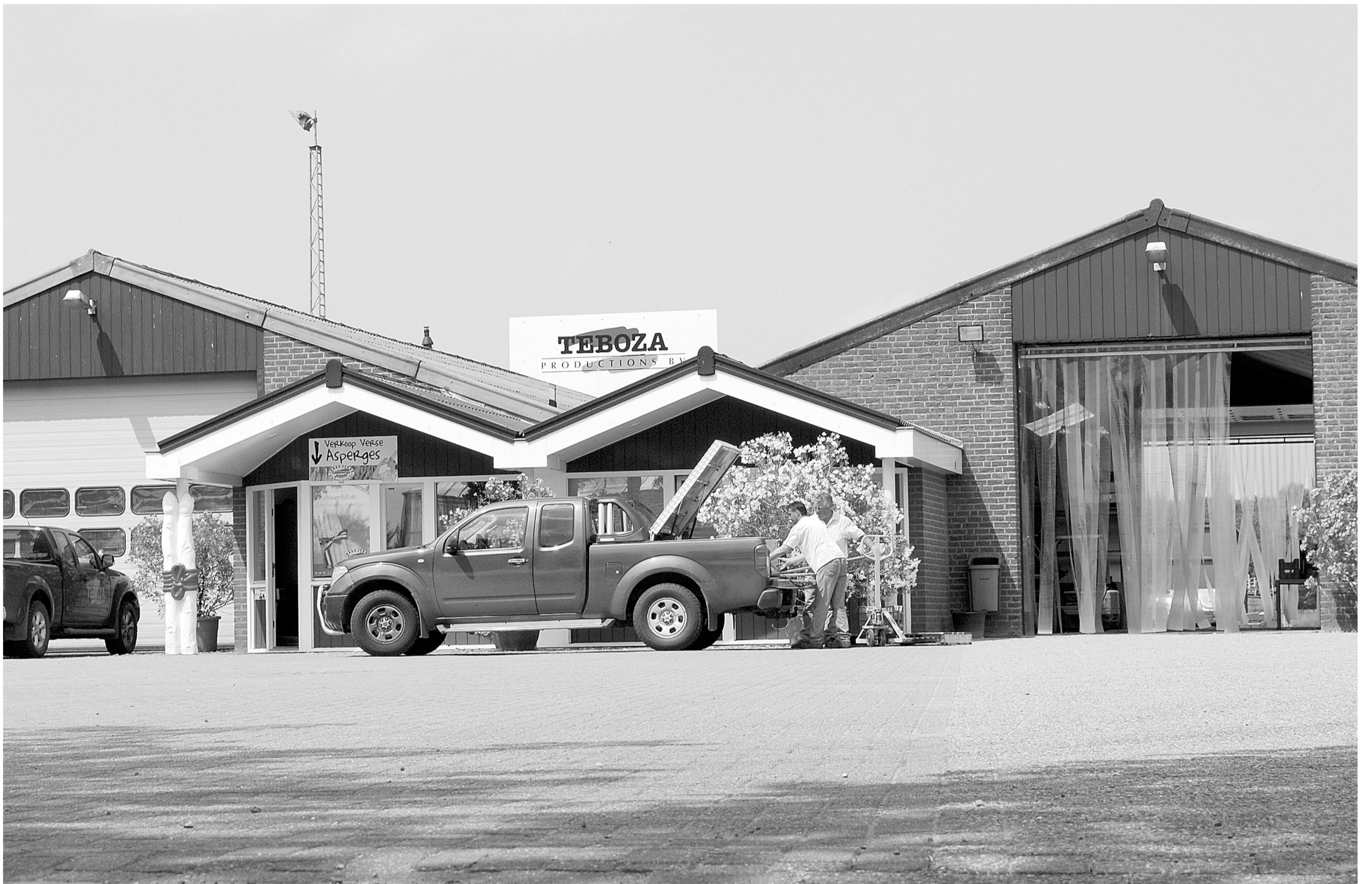
Sediul firmelor Procont și Teboza Holding se află în orașul Helden din Olanda