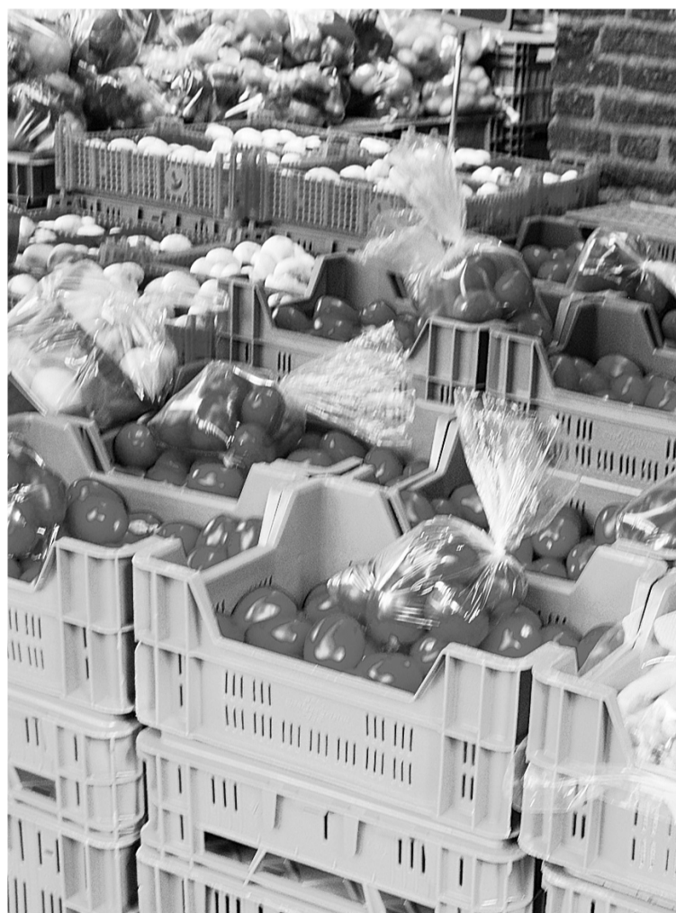
Olandezii cheltuiesc 10 milioane de euro anual pentru sparanghel